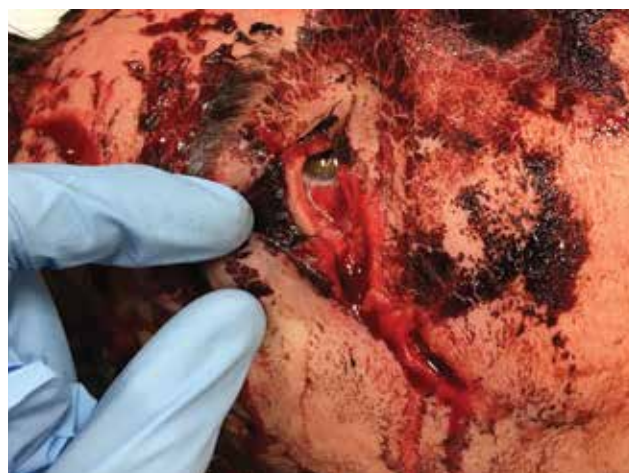
Obrázek 3-a. Otevřená rána zevního koutku, včetně vytrženého dolního kantálního ligamenta. Pacient po autonehodě