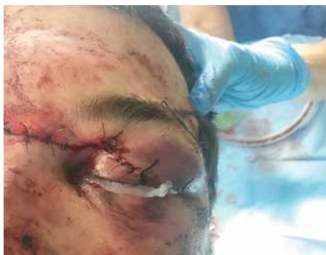
Obrázek 5-b. Stav bezprostředně po rekonstrukci víčka oftalmologem

[19]. Role MR je i důležitá v diagnostice traumatické neuropatie optického nervu.