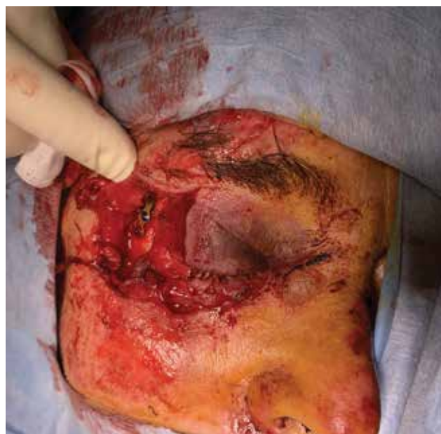
Obrázek 6-a. Těžké poranění očníce a víček při autonehodě. Je patrná již provedená rekonstrukce zlomeniny vnější stěny očníce stomatochirurgem

U všech traumat bychom měli ověřit, zda má pacient platné očkování proti tetanu a zda je rekonstrukci možné provést v lokální anestezii. Obecně ale platí, že pro rozsáhlá poranění víček, poranění slzných cest,