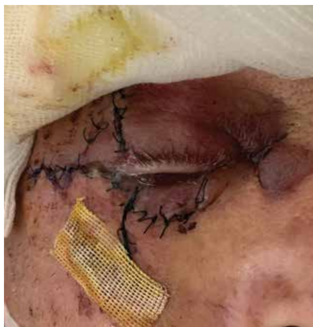
Obrázek 6-b. Nález při kontrole první den po rekonstrukci