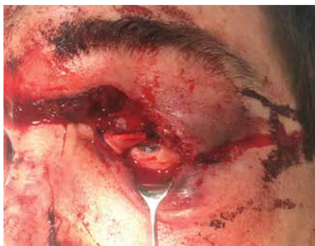
Obrázek 5-a. Profesionální poranění pilou. Rána na horním víčku je natolik hluboká, že došlo k poškození musculus levator palpebrae superioris

V případě orbitálního poranění pak vždy doplňujeme zobrazovací metodu, primárně CT [19]. CT vyšetření nám navíc může pomoci při nepřehledném nálezů vyloučit poranění očního bulbu – jeho sensitivita je v tomto případě kolem 75 % [20]. Navíc má nezastupitelnou úlohu při identifikaci cizího tělesa v očníci. Jedině pokud je definitivně cizí kovové těleso očníce či bulbu vyloučeno, můžeme přistoupit k vyšetření magnetickou rezonancí (MR). MR je užitečná při detekci některých organických cizích těles, či pro lepší přehlednutí formovaného hematomu