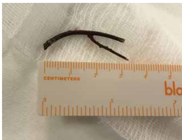
Obrázek 4-b. Extrahovaná větvička z přední části očníce

U kontuzí očníce je nutné pamatovat, že dle některých prací až 29,4 % může být spojeno s blow-out zlomeninou očníce [17]. Proto by tito pacienti měli být důsledně vyšetřeni včetně zobrazovací metody.