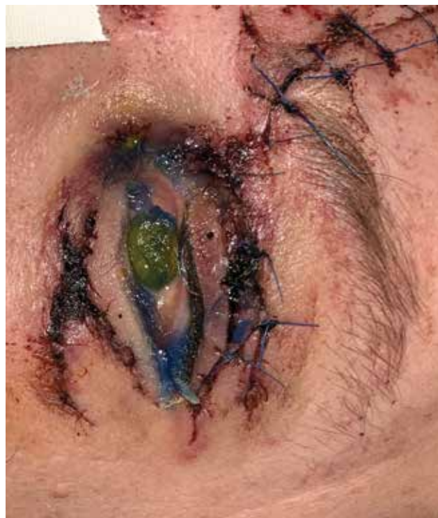
Obrázek 8. Fotografie ukazuje vzácnější komplikaci okuloplastických traumat – pacient po úraze (autonehoda) – pravděpodobně ztrátové poranění horního víčka po primární rekonstrukci – s nálezem expoziční keratitidy při lagoftalmu na podkladě nedovírání oční štěrbinu

Prevalence retrobulbárního hematomu se obecně pohybuje mezi 0,4–1,7 % [36,37,38].