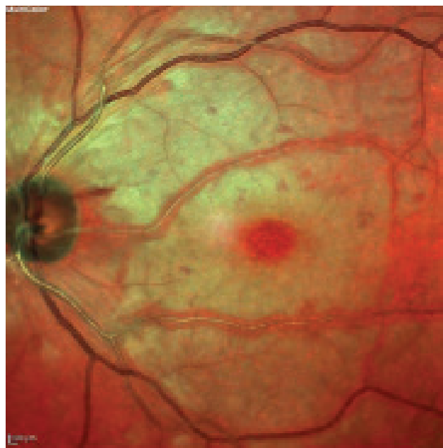
Obrázek 1. Bledý vzhled sítnice s třešňovou skvrnou v makule – příznaky CRAO trvající 6,5 hodiny CRAO – central retinal artery occlusion

Po několika týdnech od okluze je možné zaznamenat atrofii optického nervu a přítomnost cilioretinálních kolaterál. U 18 % pacientů se do pěti měsíců od okluze rozvíjí